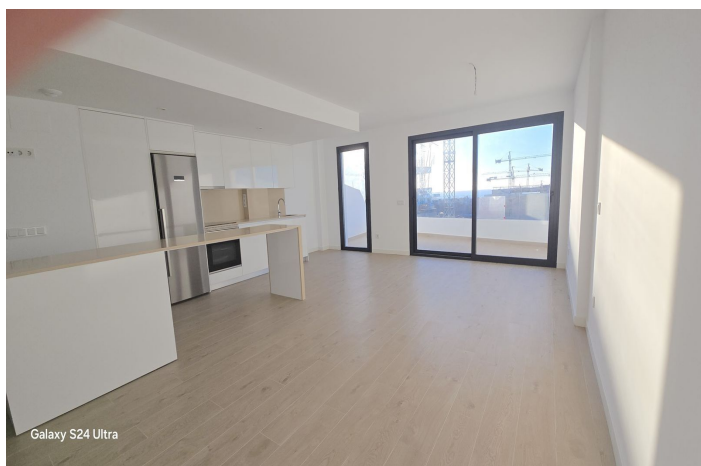
Galaxy S24 Ultra