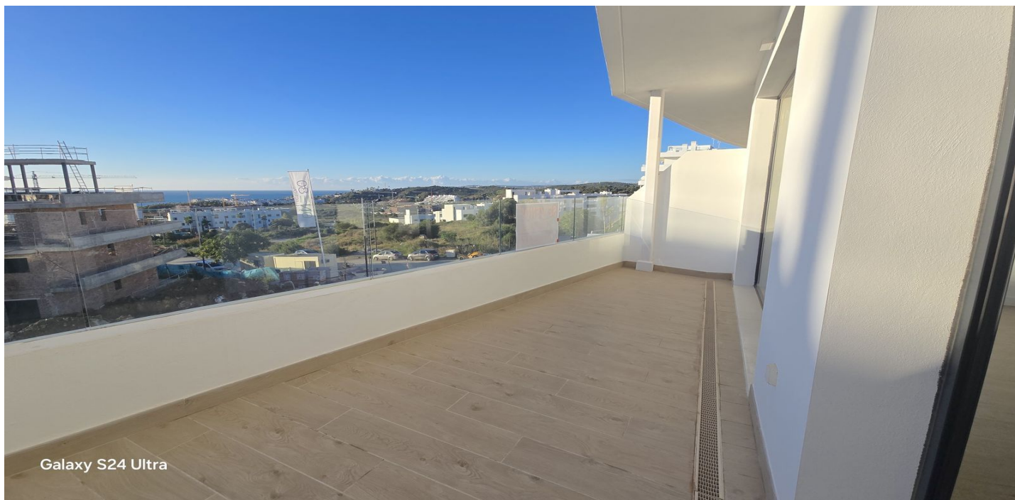
Galaxy S24 Ultra

Referentie: R4810156 Slaapkamers: 3 Badkamers: 2 Perceelgrootte: 120m 2 Terras: 16m 2