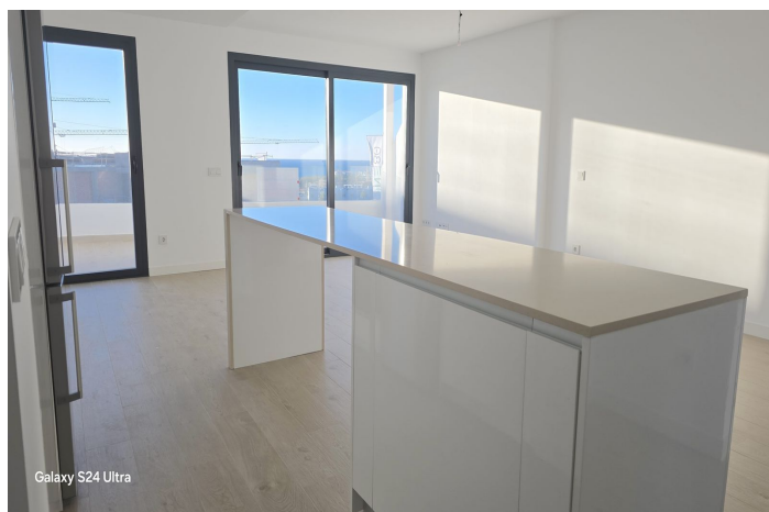
Galaxy S24 Ultra