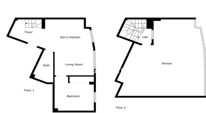
Floor Plan Created by Cubicasa App. Measurements Deemed Highly Reliable But Not Guaranteed.