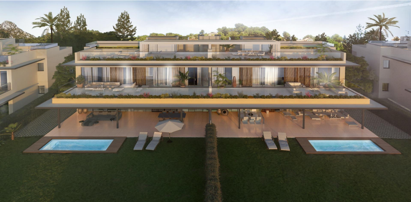
PARCELA 2.3 PORTAL 10 / PLANTA PRIMERA PUERTA B

Referenz: N7445 Schlafzimmer: 4 Badezimmer: 4 Garten: 252m 2 Terrasse: 118m 2