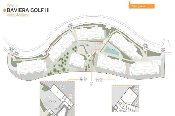
Plano del desarrollo