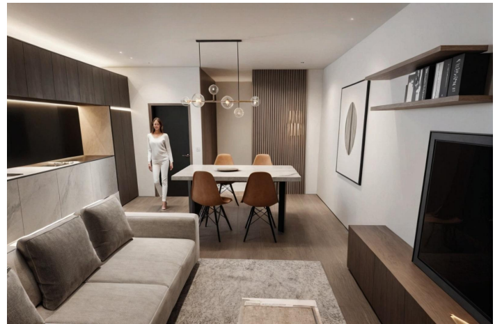
Áticos Estudio B y Vivienda A