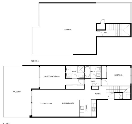
SIZES ARE APPROXIMATE, ACTUAL MAY VARY.