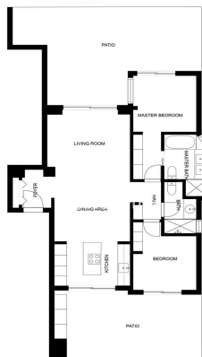
SIZES AND DIMENSIONS ARE APPROXIMATE, ACTUAL MAY VARY.