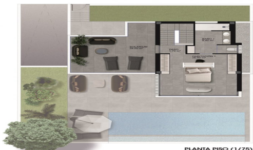
PLANTA PISO (1/75)