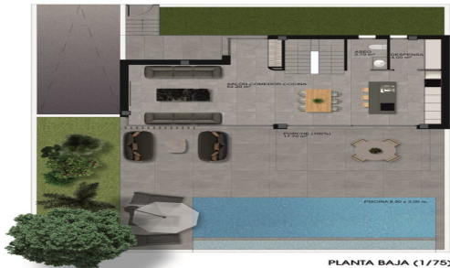
PLANTA BAJA (1/75)